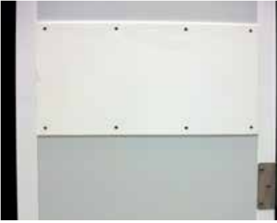
Defensa de serie

Marco ..... ■ Sistema de marco y contramarco para adaptar a cualquier espesor, posibilidad de adaptar el marco a obra civil o a panel de aluminio.