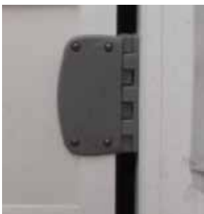
Bisagra de poliamida con retorno 90°