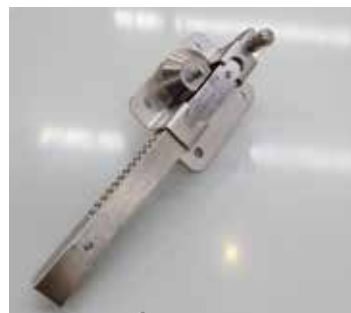
Cerradura inox de puerta batiente