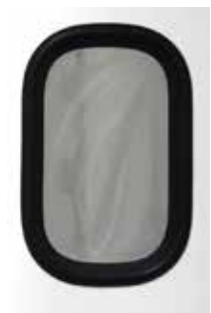
Mirilla a medida