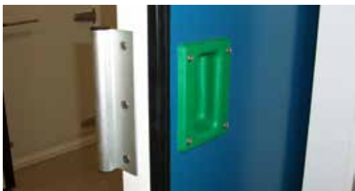
Maneta interior y exterior