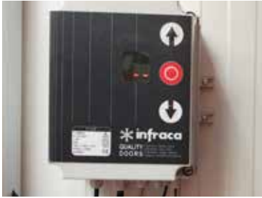
Cuadro de control IF10VF